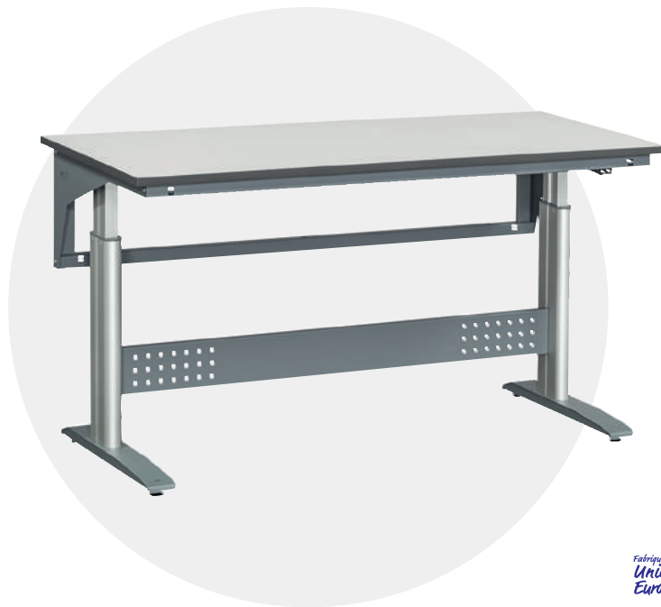
TABLE DE TRAVAIL