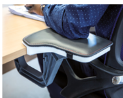
Option coussin similicuir lavable pour un meilleur confort