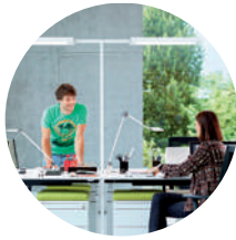
Version Twin-T jusqu'à 4 bureaux